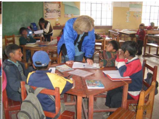
Programa educacional y medioambiental en la escuela de Kalachaca, 12 de octubre de 2010

44. Incluso luego de que los líderes de CONAMAQ y FAOI-NP solicitaran a la Compañía que abandonara esa zona en diciembre de 2010, la gran mayoría de las comunidades (incluyendo a algunos miembros de la comunidad Malku Khota) apoyaban el Proyecto. Tal como testifica el Sr. Mallory, 74 y como el mismo informó al Comité Corporativo de Responsabilidad Social de SASC (después de haber efectuado tres semanas de sesiones de información en la zona del Proyecto, poco después de su llegada a la Compañía), la mayor parte de las comunidades apoyaban el Proyecto, existiendo pequeños grupos de oposición al Proyecto. 75