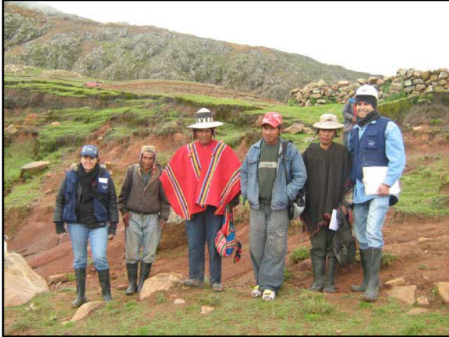
Los miembros de la comunidad Kalachaca con representantes de la Fundación Medmin tomando muestras en Malku Khota y Wara Wara, febrero de 2009

34. En junio de 2008, la Compañía contrató a Cumbre del Sajama, una firma boliviana especializada en servicios de consultoría para la industria minera. 53 Cumbre del Sajama fue específicamente contratada para apoyar los esfuerzos realizados por la Compañía en cuanto a sus relaciones con la comunidad. Una parte de este apoyo implicaba llevar a cabo talleres en distintas comunidades. El objetivo de esos talleres era reforzar las relaciones comunitarias y educar a las comunidades en cuanto a los aspectos sociales, mineros y ambientales de la minería y del Proyecto Malku Khota. 54