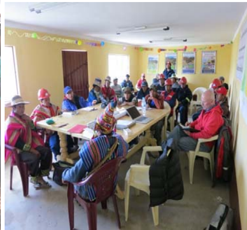
Taller de mecanismos para formulación de reclamos, febrero de 2012