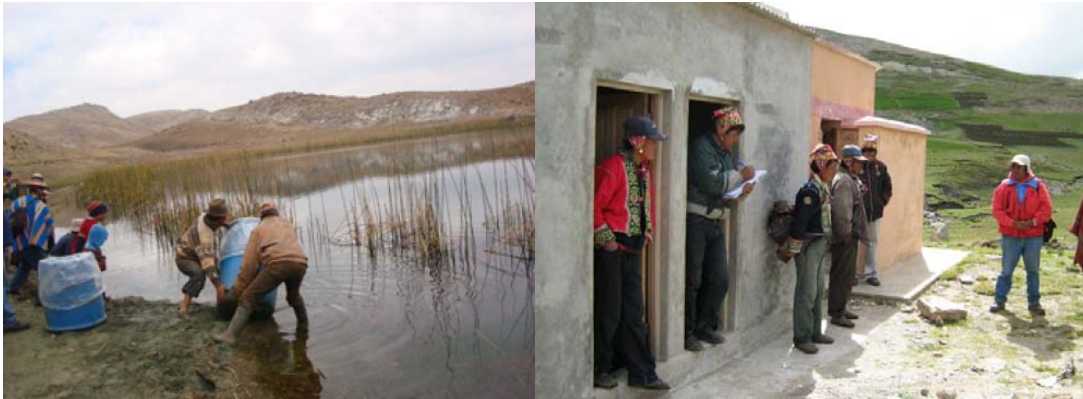
Cultivo de truchas, septiembre de 2007