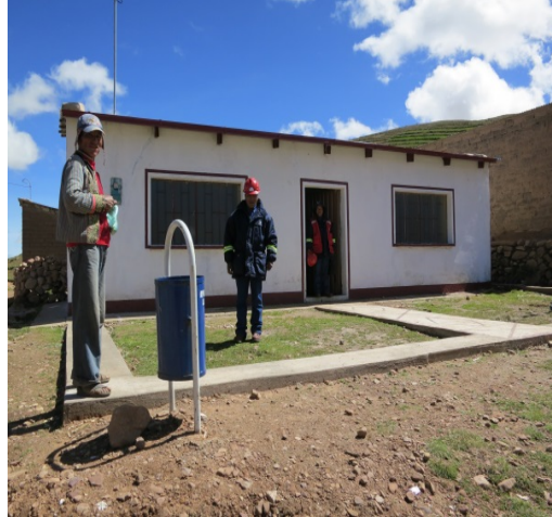
Centro comunitario reacondicionado, enero de 2012