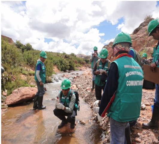
Programa de entrenamiento de monitores ambientales, marzo de 2012